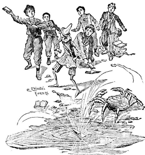
Figura 1: Illustrazione di Carlo Chiostri a Le avventure di Pinocchio (Collodi, 1901)

Alla fine dell'Ottocento, Carlo Collodi ne Le avventure di Pinocchio (1901) – romanzo simbolo di una nuova letteratura per l'infanzia italiana – narra di uno scontro tra il burattino protagonista e un gruppo di ragazzi (Figura 1); questi messa mano "ai proiettili e sciolti i fagotti de' loro libri di scuola, cominciarono a scagliare contro di lui i Sillabari , le Grammatiche , i Giannettini , i Minuzzoli , i Racconti del Thouar, il Pulcino della Baccini e altri libri scolastici" (p. 101). Pinocchio riesce a evitare i pesanti volumi e questi cadono in mare e vengono assaggiati da alcuni pesci che, però, "dopo avere abboccata qualche pagina o qualche frontespizio, la risputavano subito facendo con la bocca una certa smorfia, che pareva volesse dire: Non è roba per noi. Noi siamo avvezzi a cibarci molto meglio!" (p. 101).