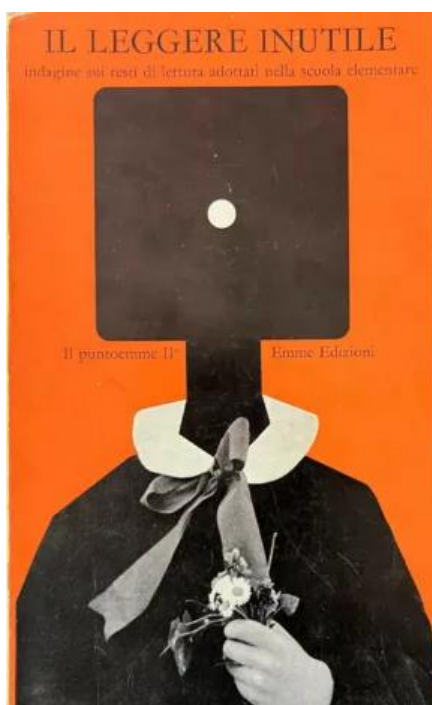
Figura 2: Copertina di Franco Bassi a Barassi et al. (1971)

L'immagine di copertina de Il leggere inutile (Barassi et al., 1971) è particolarmente significativa e comunicativa poiché mostra la fotografia di un alunno, con indosso il tradizionale grembiule scolastico, con al posto del capo un grande quadrato nero stilizzato (Figura 2). Il simbolismo è evidente: lo studente, uno studente anonimo che potrebbe essere chiunque, nella scuola tradizionale viene inquadrato , omologato, sino a uscirne spersonalizzato . L'immagine sembra suggerire che lo scopo della scuola, perseguito anche attraverso il libro di testo, è quello di creare degli studenti-burattini , incapaci di ragionare criticamente e individualmente.